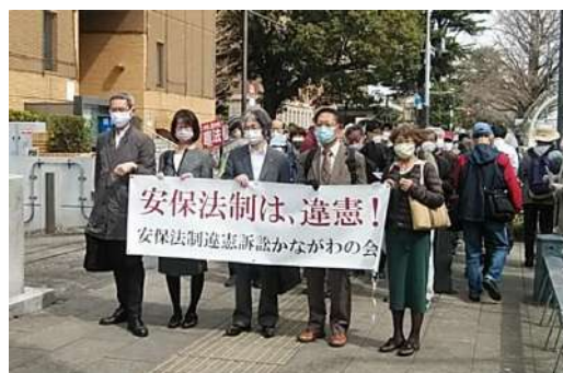
図 1 裁判所前での原告弁護団パレード

裁判を前に 10 時 20 分から集会を開き、原告と弁護団を先頭に裁判所前でパレード（図 1）をしました。その後、傍聴券の抽選がありましたが、コロナ禍で人数が少なく、残念ながら外れてしまいました。それで、報告集会の会場である YWCA で待つことになりました。