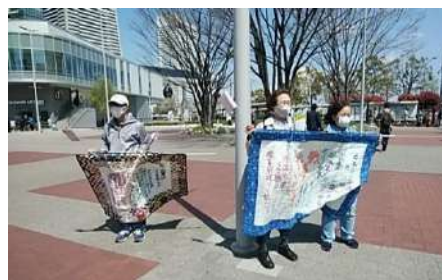
図 1 「九条キルト」の展示

桜木町駅前広場の皆さん、私たちは「九条かながわの会」と申します。私たちはここで、ウクライナに平和を、ロシア軍は即時撤退を、平和を守ろう、憲法 9 条を守る活動をしています。憲法改悪反対の署名も集めております。皆様のご協力をこころより呼びかけます。